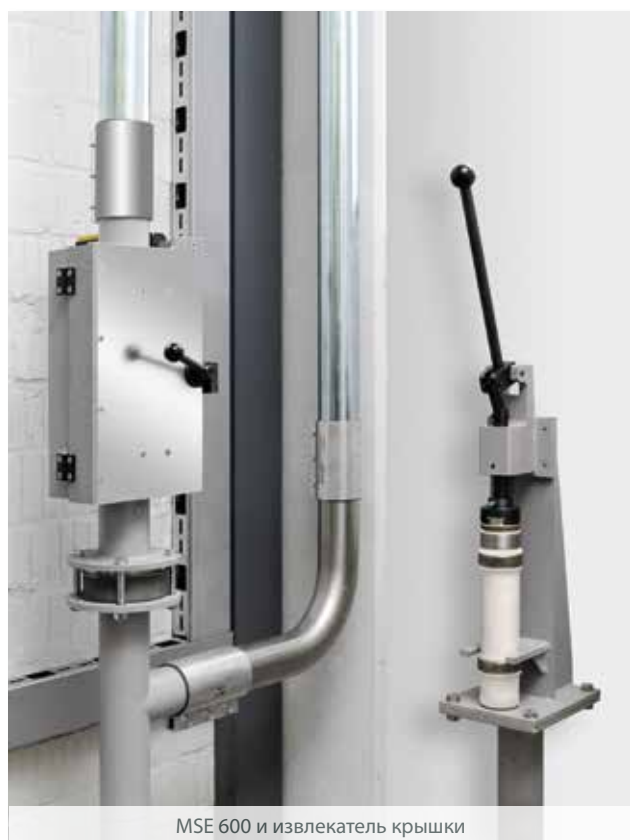
MSE 600 и извлекатель крышки