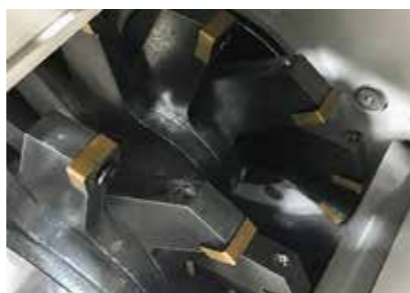
Rotor: Versão moinho de corte

A cominuição no moinho de martelos / moinho de corte é feita a través de um rotor de alta velocidade, com martelos montados em pêndulos (versão moinho de martelos) ou com lâminas de corte aparafusadas (versão moinho de corte).