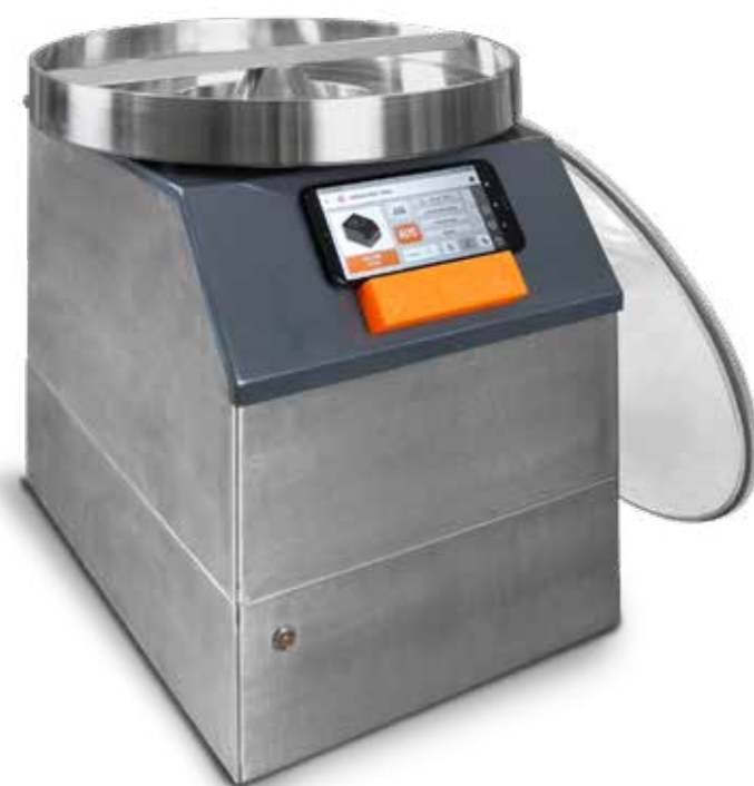
SLS com adaptador de peneira de 400mm e dispositivo de pré-aquecimento de ar

As partículas finas são aspiradas através das aberturas da peneira para o recipiente do aspirador e são coletadas. O vácuo necessário para isso, bem como o tempo de peneiramento, podem ser predefinidos através do aplicativo e podem ser salvos usando SOPs.