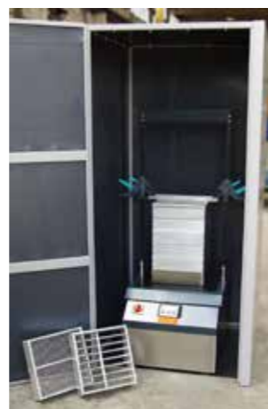
ASM com isolamento acústico e peneiras com barras