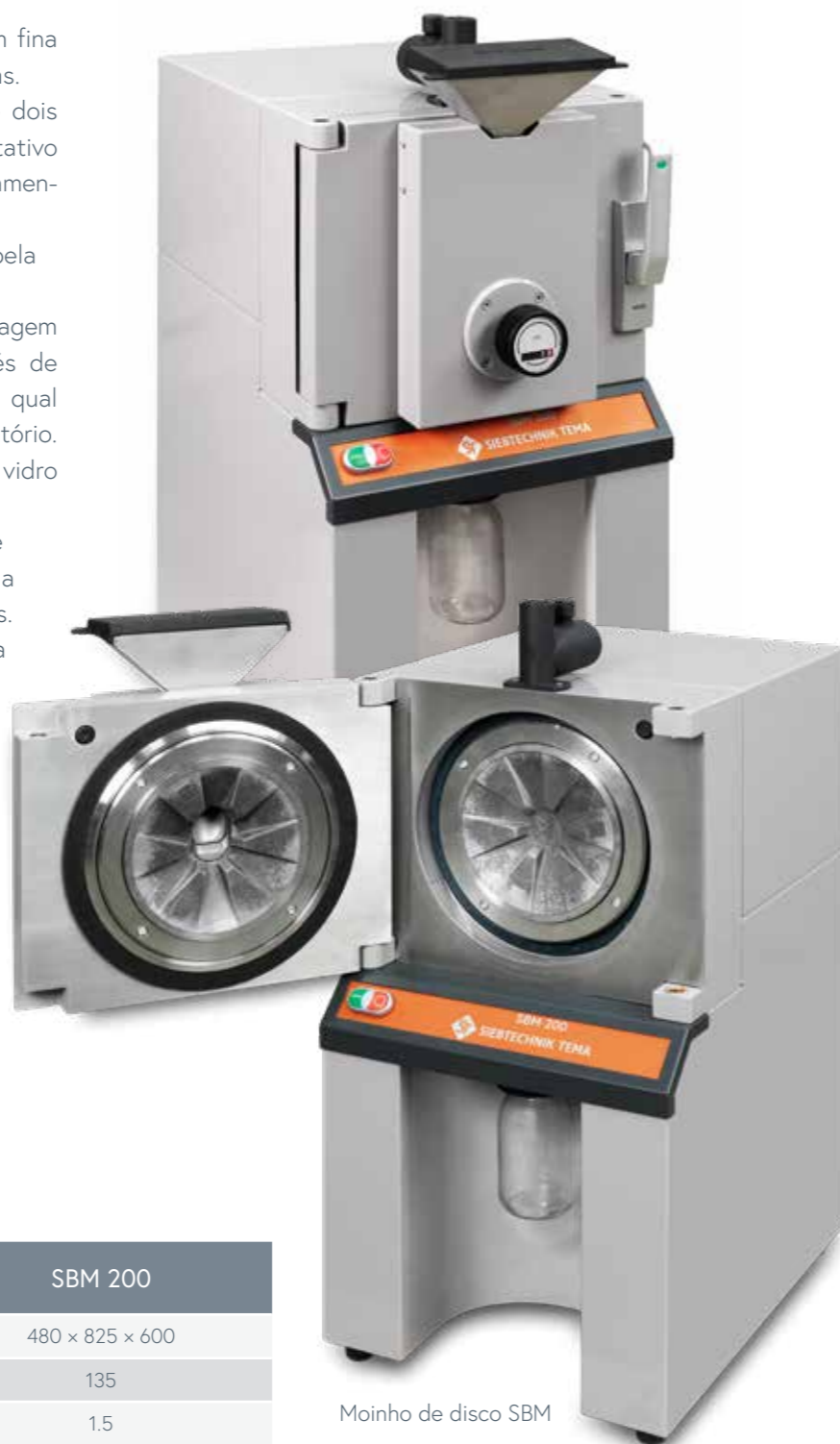
Moinho de disco SBM

Os discos de moagem estão disponíveis, em aço fundido, óxido de zircônio ou carbetto de tungstênio.