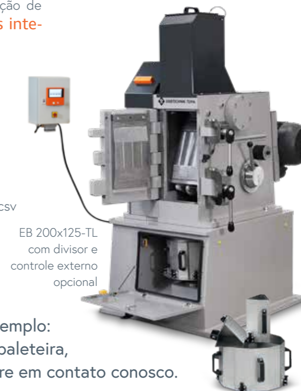
EB 200x125-TL com divisor e controle externo opcional

Se houver quaisquer outros requerimentos, por exemplo: a estrutura base que pode ser recolhida por uma paleteira, alimentação contínua de material, ... por favor entre em contato conosco.