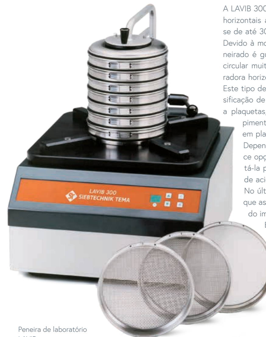
Peneira de laboratório LAVIB

A função de ligar/desligar e as configurações de duração do peneiramento do equipamento são controladas através de um teclado claramente estruturado e rotulado.