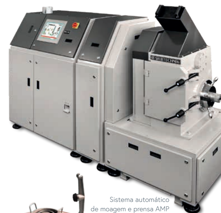
Sistema automático de moagem e prensa AMP