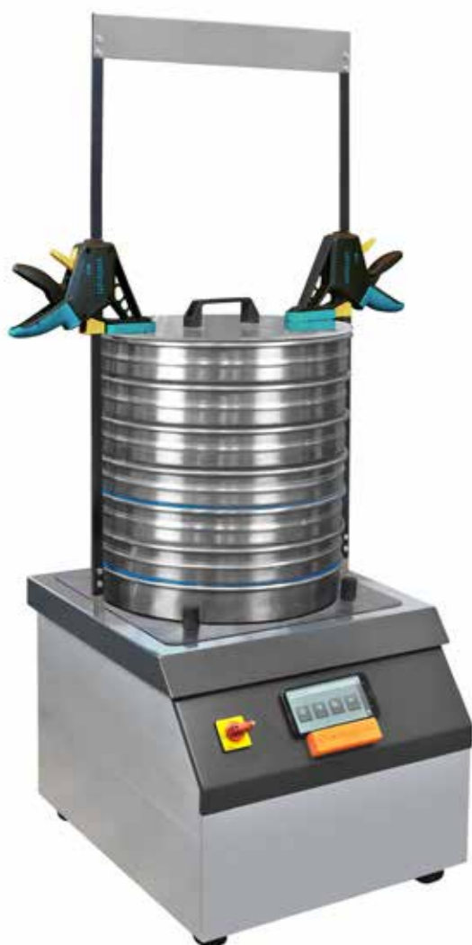
Peneira de análise ASM 400