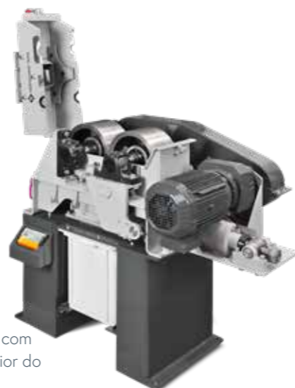
WS 250x150-L com invólucro superior do moinho aberto