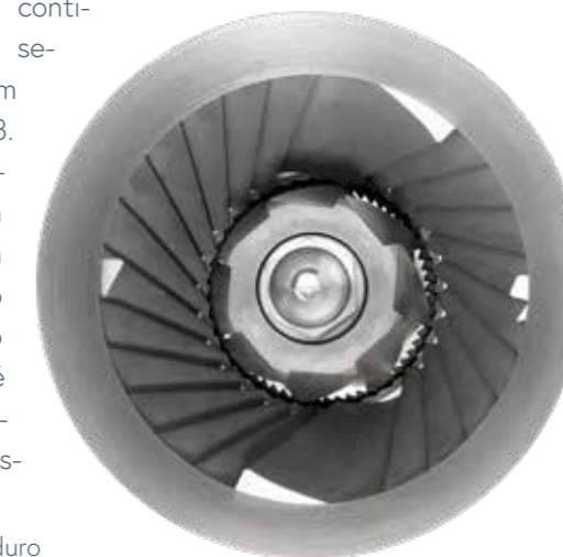
Metal duro Elementos de moagem feitos de carbeto de tungstênio

Para assegurar uma longa vida útil, todo o mecanismo de moagem é feito de carbeto de tungstênio.