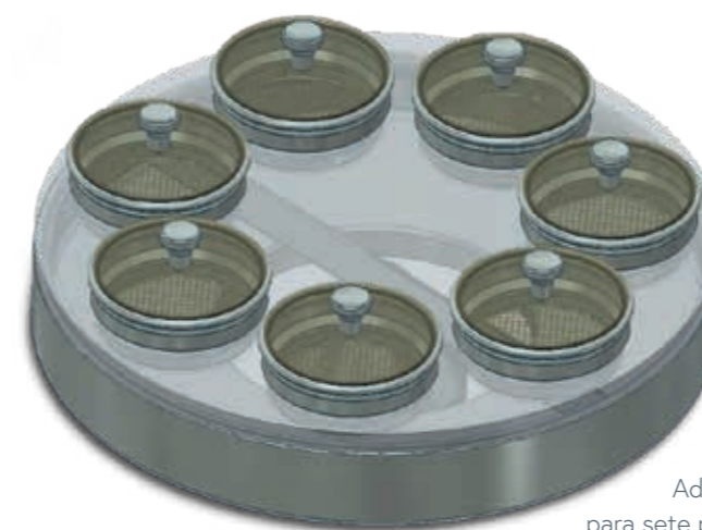
Adaptador para sete peneiras de diâmetro de 100mm