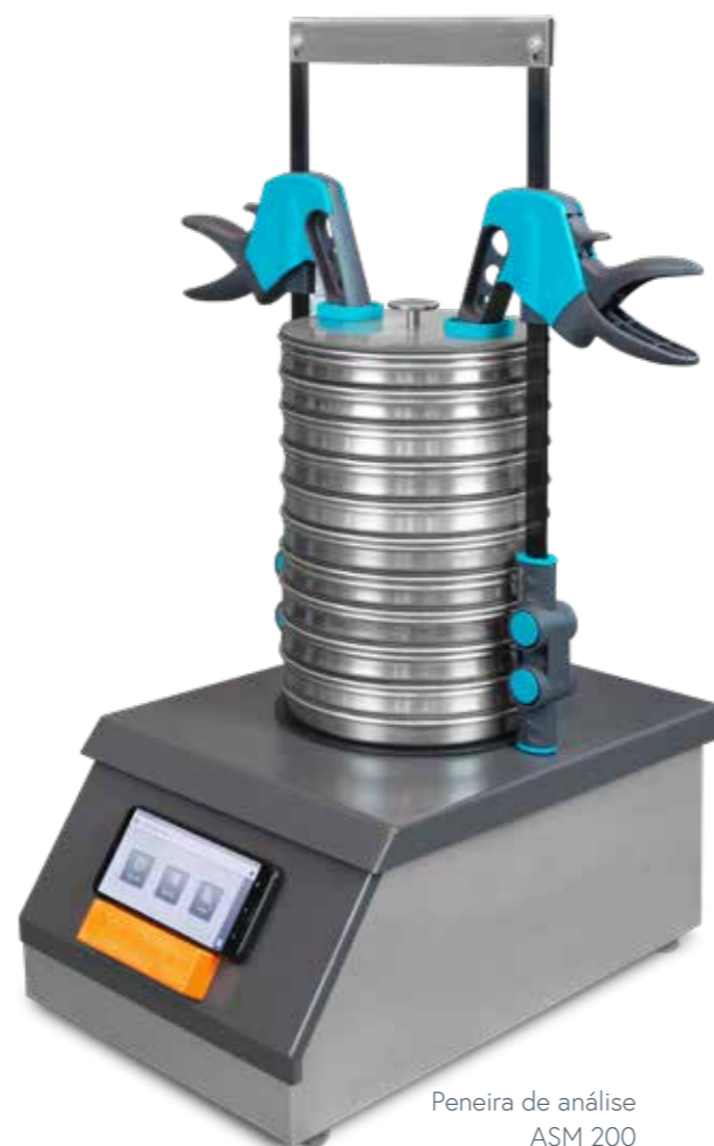
Peneira de análise ASM 200