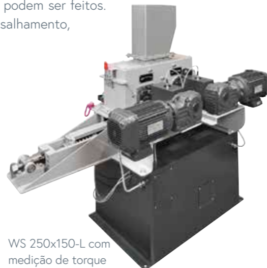
WS 250x150-L com medição de torque