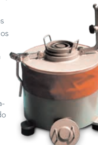
Moinho de disco de laboratório T 750