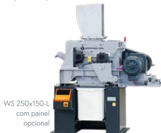
WS 250x150-L com painel opcional

A capacidade de moagem depende da largura da abertura de descarga, da densidade aparente e do comportamento do material a ser moído. A granulometria final obtida é majoritariamente determinada pela abertura de descarga selecionada e do comportamento do material. Sujeito a mudanças técnicas.