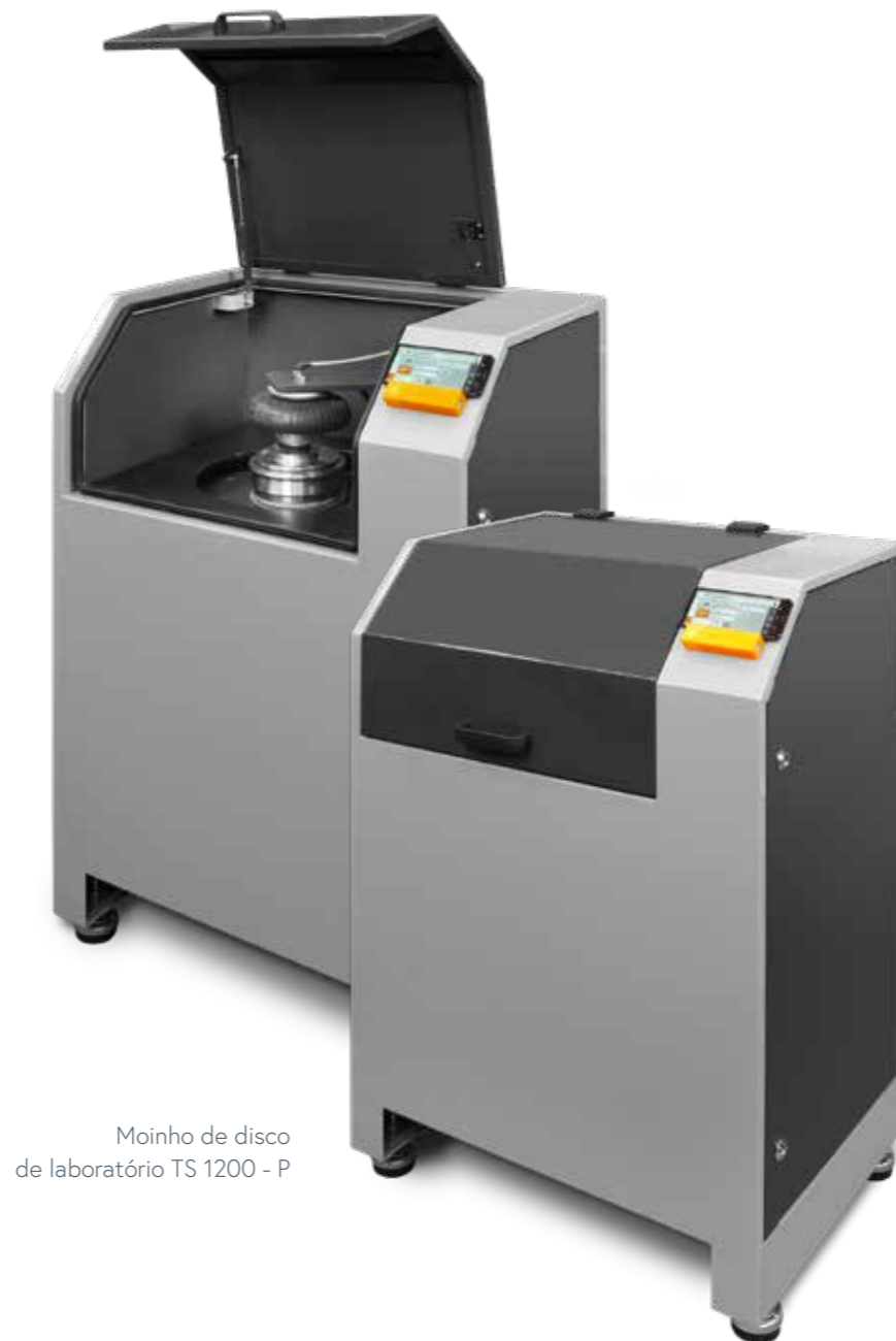
Moinho de disco de laboratório TS 1200 - P