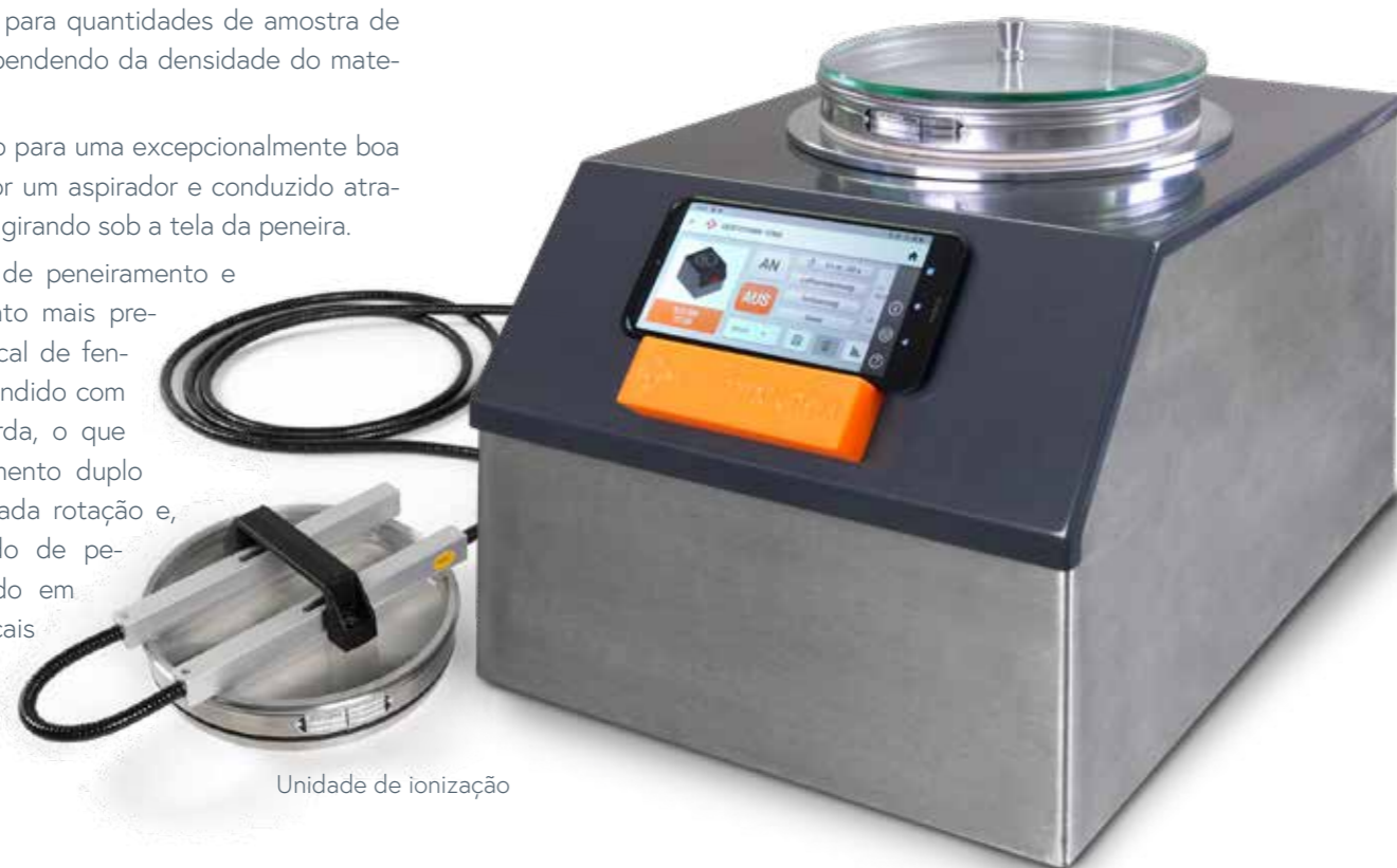
Unidade de ionização

Para reduzir o tempo de peneiramento e atingir um peneiramento mais preciso, o formato do bocal de fenda foi alongado e estendido com uma dispersão de borda, o que assegura um afrouxamento duplo na área da borda a cada rotação e, portanto, um resultado de peneiramento mais rápido em comparação com bocais convencionais.