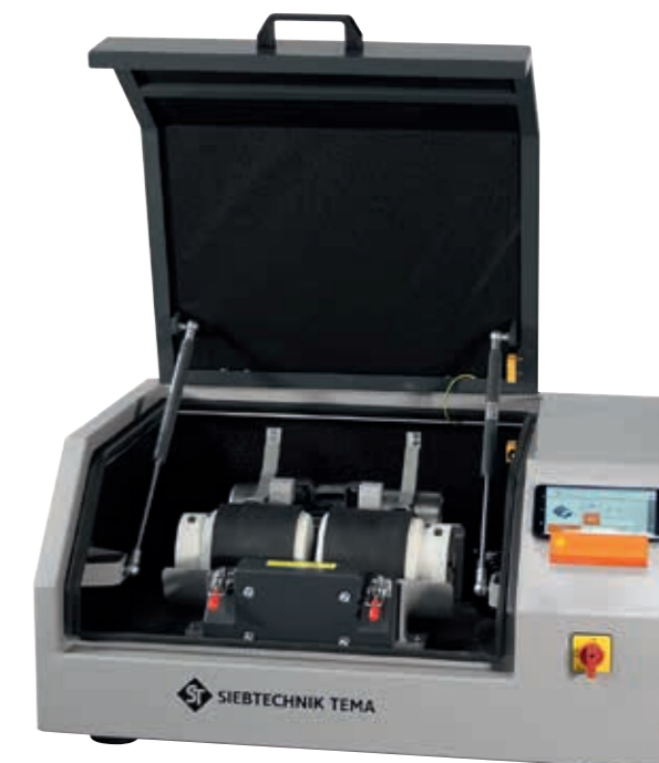
Molino vibratorio GSM06 con recipientes de porcelana