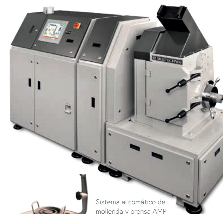
Sistema automático de molienda y prensa AMP