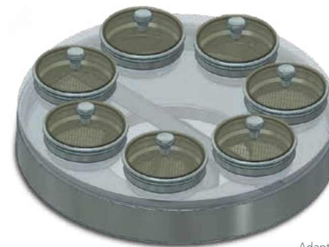
Adaptador para siete tamices con diámetro de 100 mm