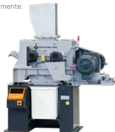
WS 250x150-L con pantalla opcional

La capacidad de molienda depende del tamaño de la abertura de descarga, de la densidad aparente y del comportamiento del material al ser molido. La finura final obtenida está mayoritariamente determinada por la abertura de descarga seleccionada y por el comportamiento del material al ser molido. Sujeto a modificaciones técnicas.