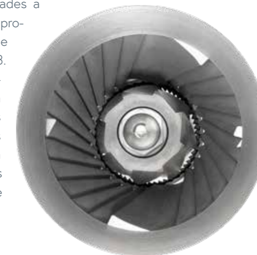
Carburo metálico Elementos de molienda hechos de carburo de tungsteno

Para garantizar una larga vida útil, los elementos de molienda están hechos de carburo de tungsteno.