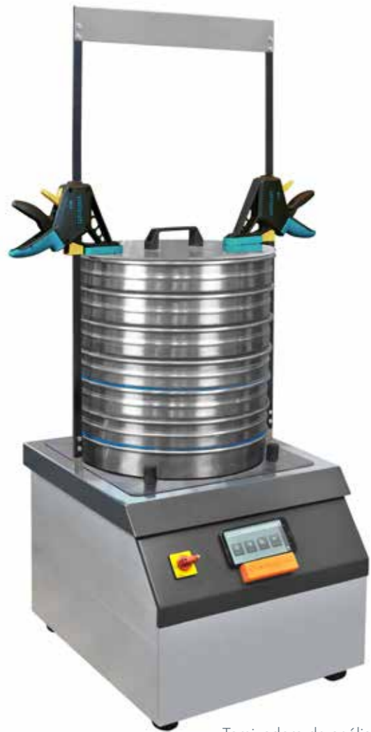
Tamizadora de análisis ASM 400

Principalmente, la ASM400 se destaca por las siguientes características: