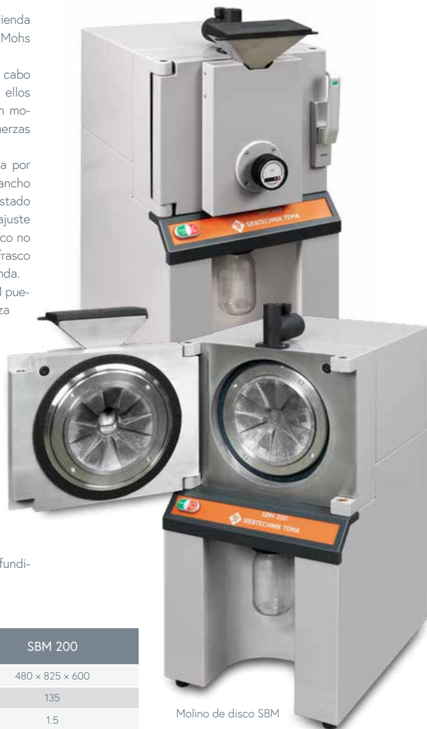
Molino de disco SBM