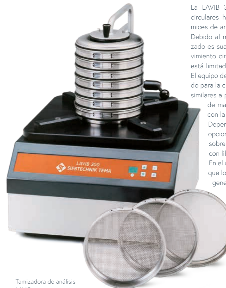
Tamizadora de análisis LAVIB

La función de encendido/apagado y las configuraciones de duración de tamizado del equipo son controladas a través de un teclado claramente estructurado.