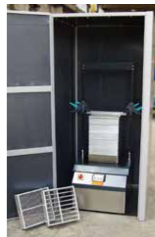
ASM 400 con aislamiento acústico y tamices con barras