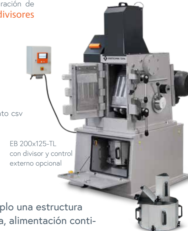
EB 200x125-TL con divisor y control externo opcional

para dividir la cantidad de muestra en las siguientes proporciones: 3x 1:4 y 2x 1:8