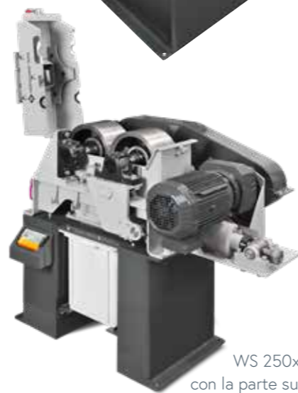
WS 250x150-L con la parte superior de la carcasa abierta