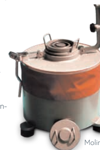
Molino de disco de laboratorio T 750