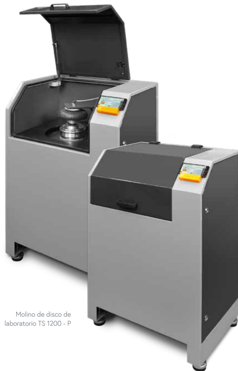
Molino de disco de laboratorio TS 1200 - P