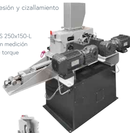
WS 250x150-L con medición de torque