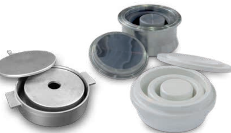
Vasijas de molienda de óxido de circonio, acero y ágata

Los elementos de molienda (discos / anillos) de la vasija son puestos en movimiento de impacto rotativo a través de una vibración circular. Este movimiento genera grandes fuerzas que rápidamente resultan en una finura analítica.