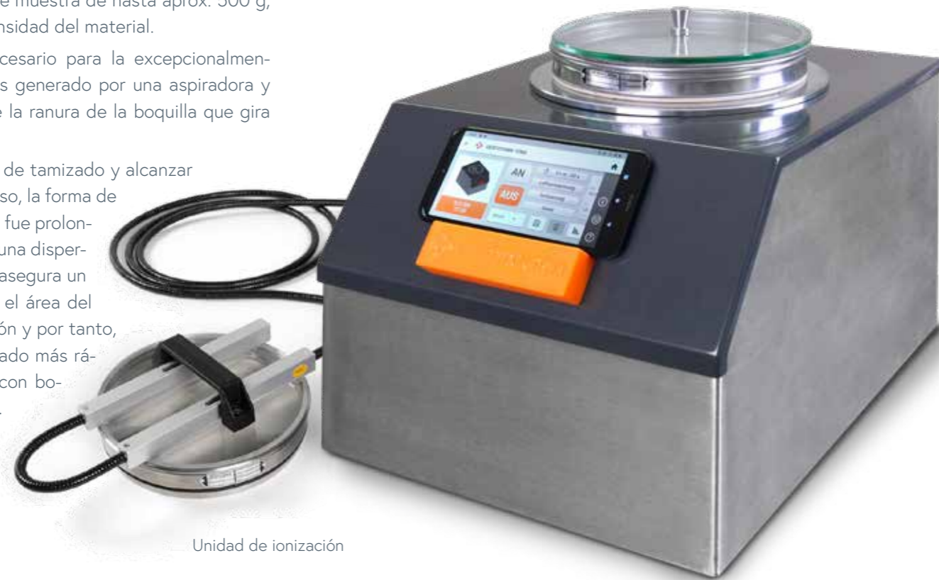
Unidad de ionización

Para reducir el tiempo de tamizado y alcanzar un tamizado más preciso, la forma de la ranura de la boquilla fue prolongada y extendida con una dispersión del borde, lo que asegura un aflojamiento doble en el área del borde con cada rotación y por tanto, un resultado de tamizado más rápido en comparación con boquillas convencionales.