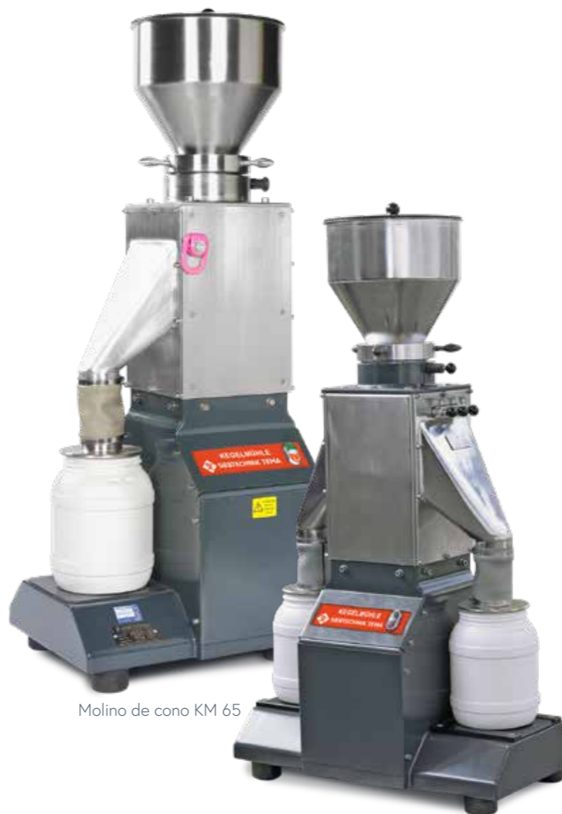
Molino de cono KM 65