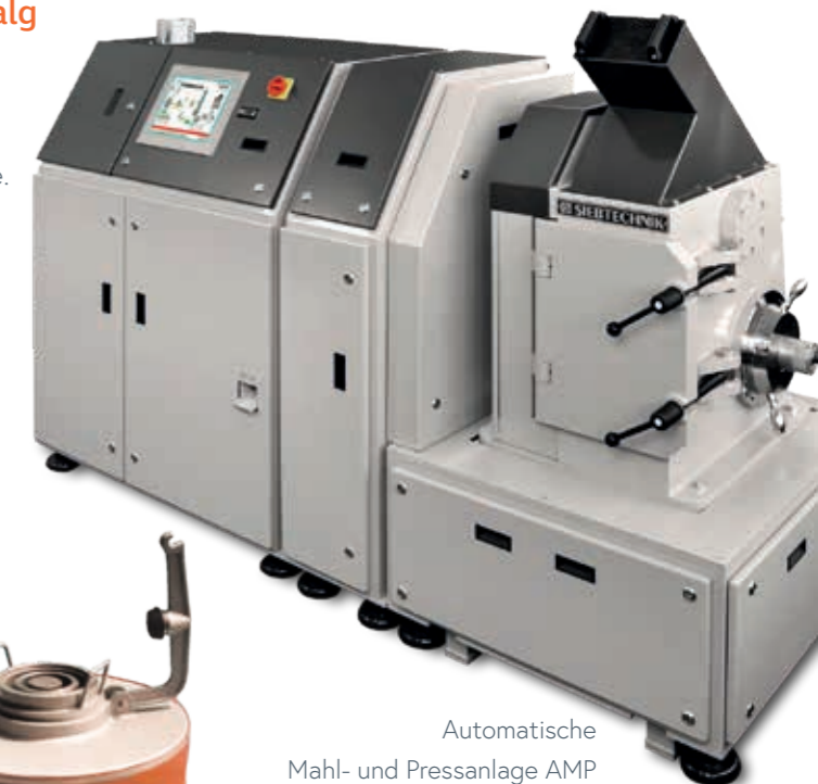
Automatische Mahl- und Pressanlage AMP