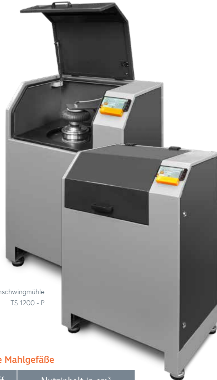
Scheibenschwingmühle TS 1200 - P