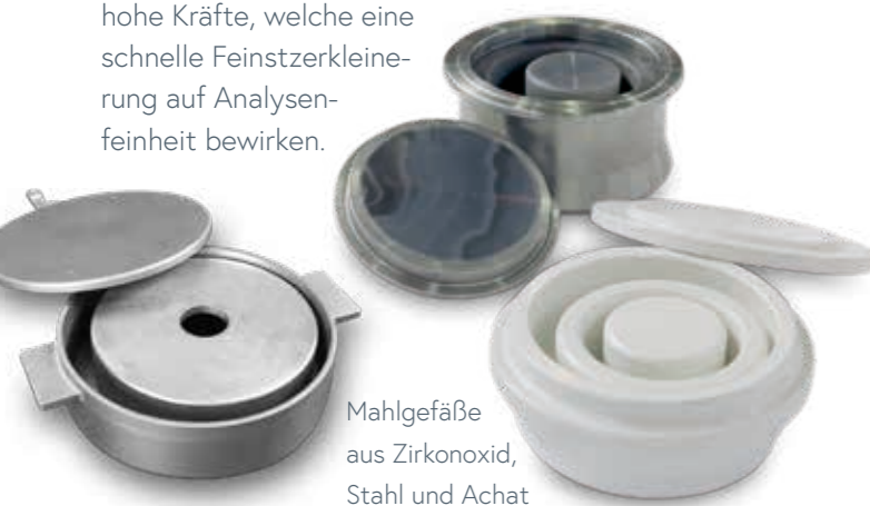
Mahlgefäße aus Zirkonoxid, Stahl und Achat

Die im Mahlgefäß befindlichen Mahlkörper (Stein/Ringe) werden durch eine Kreisschwingung in eine abrollende Schlagbewegung versetzt. Diese Bewegung erzielt sehr hohe Kräfte, welche eine schnelle Feinstzerkleinerung auf Analysenfeinheit bewirken.