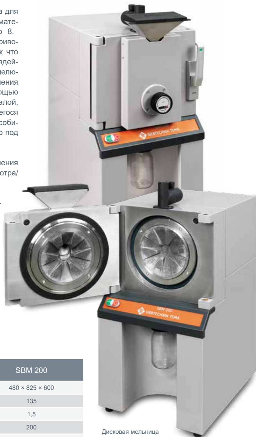
Дисковая мельница SBM-200

Мелющие диски могут быть изготовлены из литой стали, оксида циркония или карбида вольфрама.