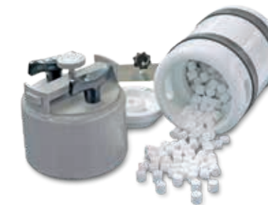
Помольные камеры из стали и керамики с мелющими телами