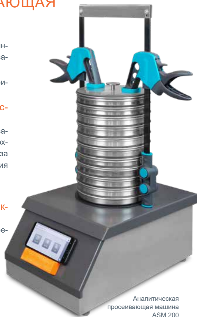
Аналитическая просеивающая машина ASM 200