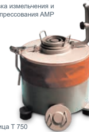
Дисковая вибромельница T 750