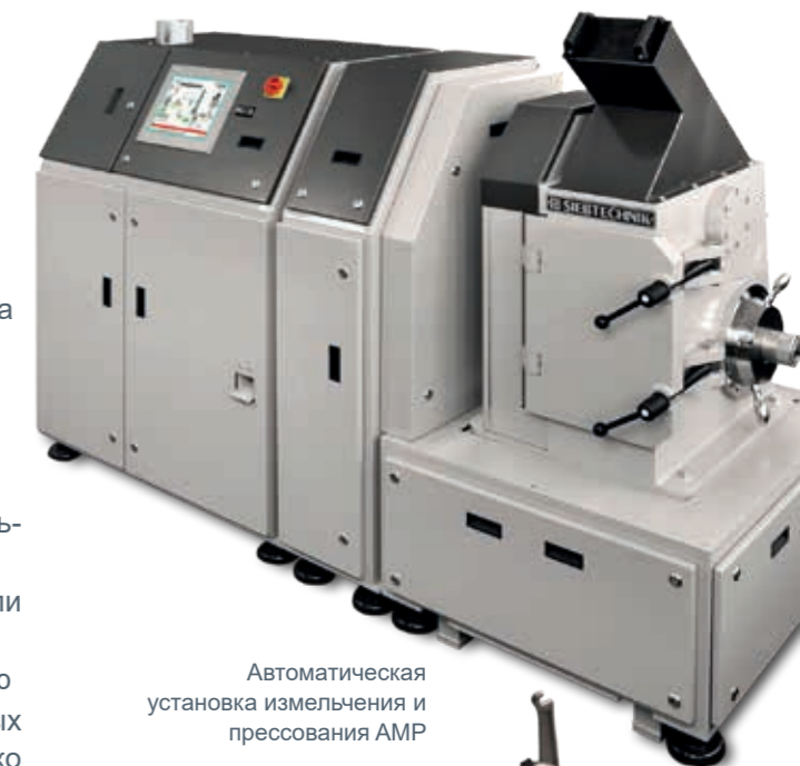
Автоматическая установка измельчения и прессования AMP