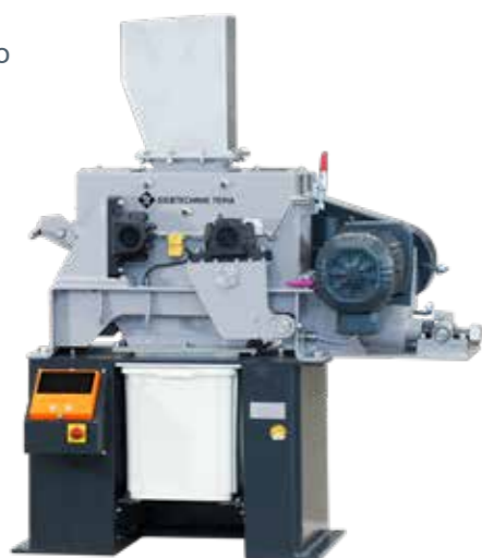
WS 250x150-L с опциональным дисплеем