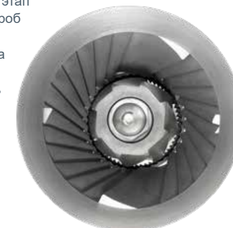
Измельчающие элементы из карбида вольфрама

Пробы материала можно непрерывно сокращать в диапазоне 1:2, 1:4 или 1:8. Для обеспечения длительного срока службы все измельчающие элементы изготовлены из карбида вольфрама (WC).