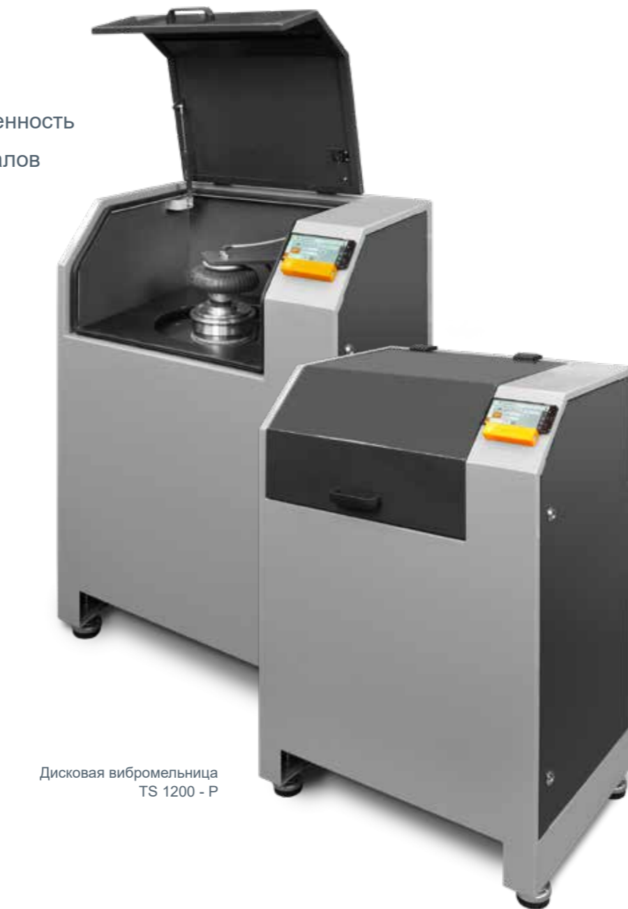
Дисковая вибромельница TS 1200 - P