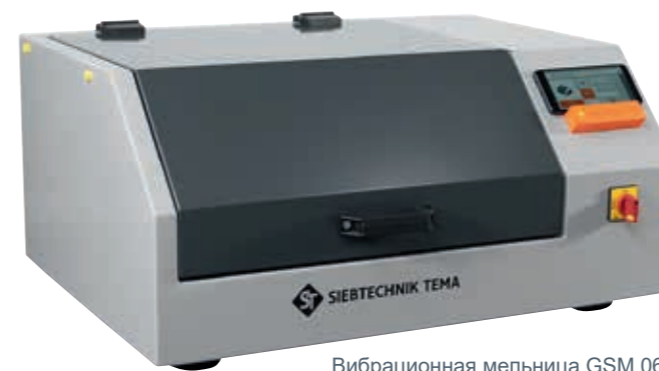
Вибрационная мельница GSM 06