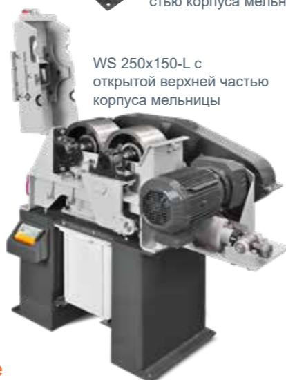
WS 250x150-L с открытой верхней частью корпуса мельницы