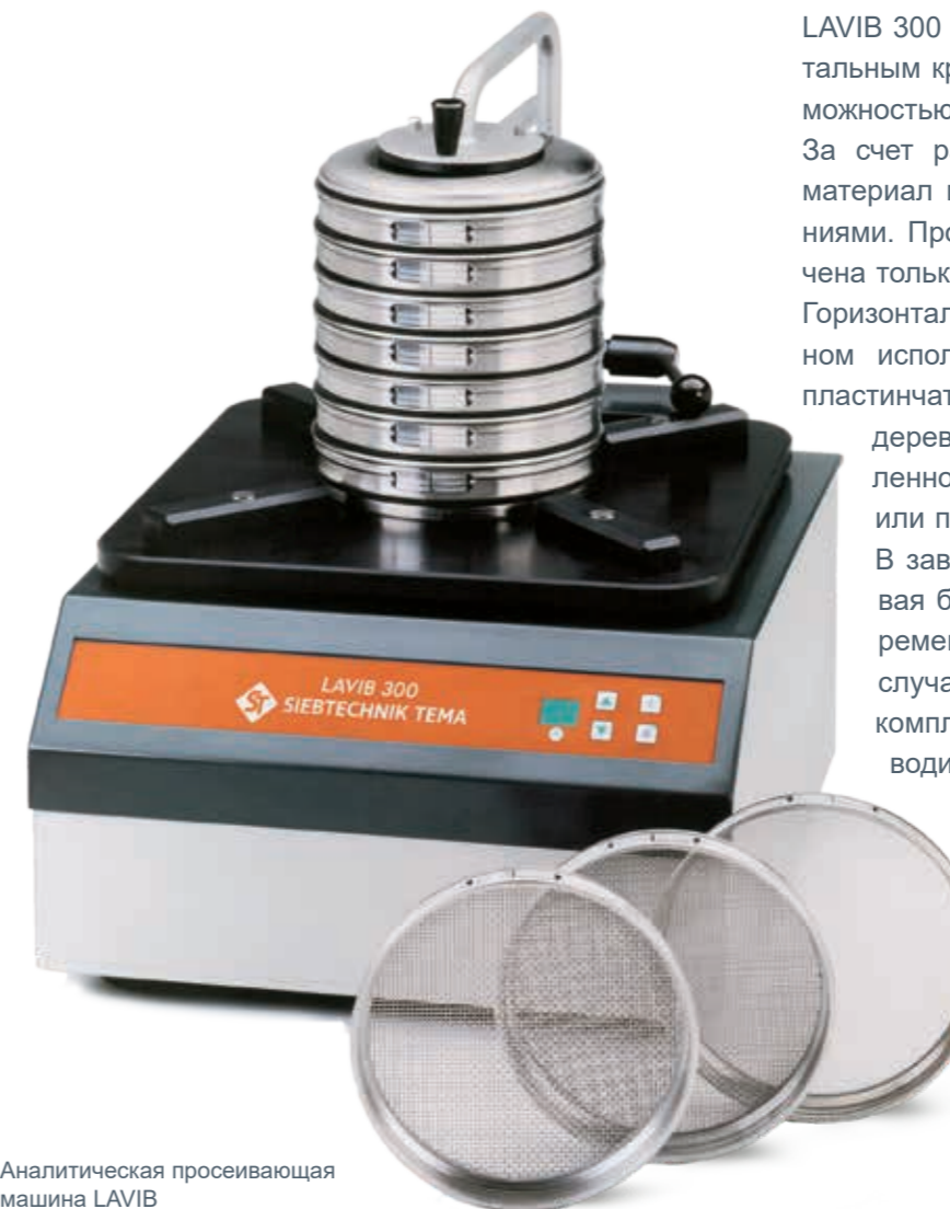
Аналитическая просеивающая машина LAVIB

Управление не требующей технического обслуживания машиной осуществляется с помощью четко структурированной сенсорной клавиатуры с функциями включения/выключения и установки времени просеивания.