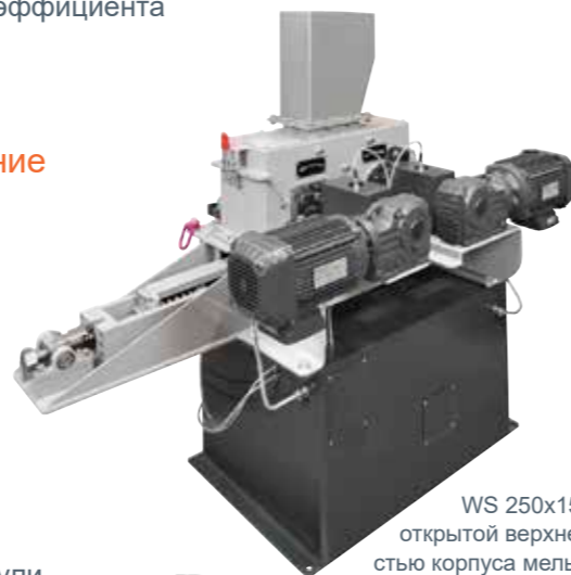
WS 250x150-L с открытой верхней частью корпуса мельницы