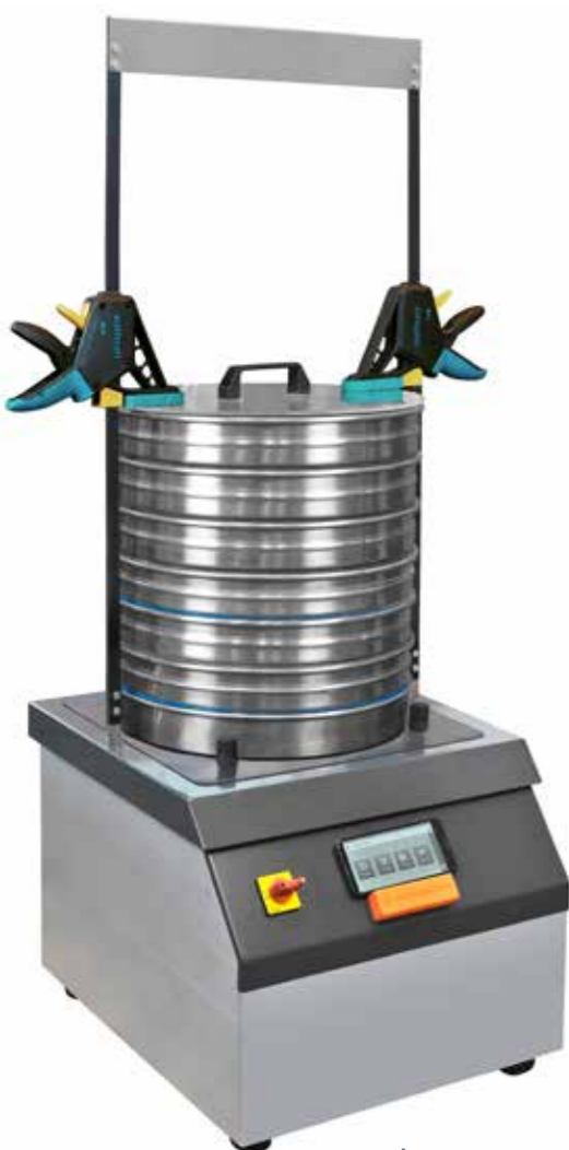
Аналитическая просеивающая машина - ASM 400