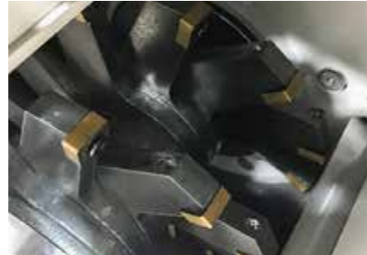
Ротор: Исполнение ножевая мельница

Измельчение в молотковой/режущей мельнице осуществляется высокоскоростным ротором, либо с маятниковыми молотками (версия молотковая мельница), либо с привинченными режущими пластинами (версия режущая мельница).